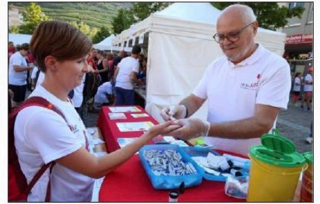
Test de glycémie par l'insulib, association pour la promotion de l'insulinothérapie fonctionnelle dans la région Est.