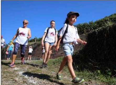
De nombreux enfants ont participé en courant ou en marchant à cette manifestation au profit de la ligue contre le cancer. Certains sont même à l'origine de la participation des parents.