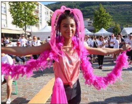
Cette jeune participante n'a pas hésité à venir avec quelques accessoires.