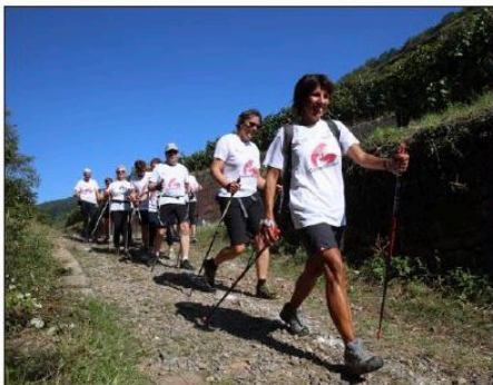
35 personnes du Nordic Walking Florival ont participé à cette première « Guebwilleroise ».