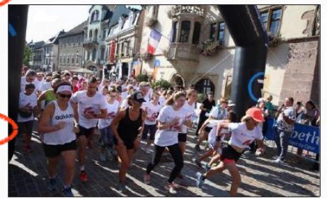
Le départ de la course à pied.

REGARDER Notre diaporama sur www.lalsace.fr