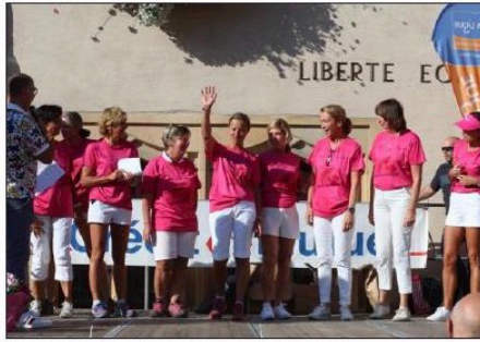
L'équipe des neuf organisatrices de la première « Guebwilleroise ».