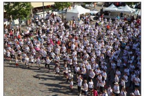
Échauffement collectif pour petits et grands sur un rythme endiablé avant le départ.